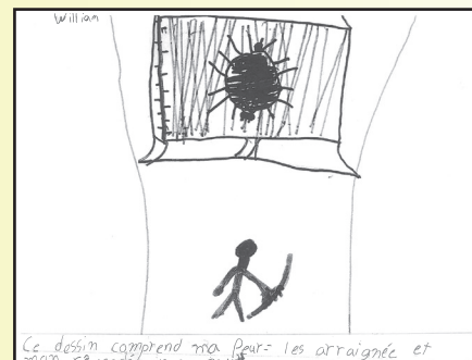
Ce dessin comprend ma peur = les araignées et mon rêve = détruire ma peur.

de Longueuil. Ce fut un échange exceptionnel, les jeunes initiés répondant aux questions des néophytes !